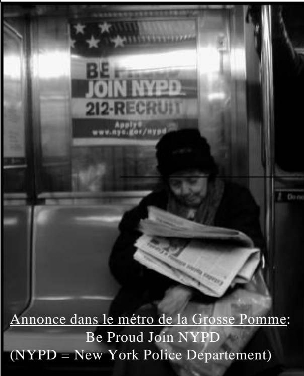
Annnonce dans le métro de la Grosse Pomme: Be Proud Join NYPD (NYPD = New York Police Department)

Fête de l'Huma : toujours à la recherche d'une cause perdue à défendre, Noir Désir décommande son concert par solidarité pour les femmes battues dans le monde